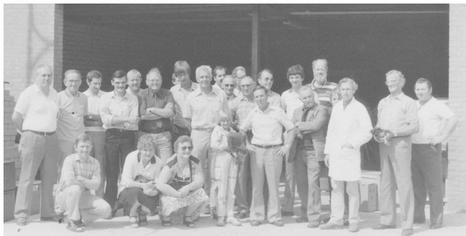
Een goede opkomst op deze fokkersdag van de toen jonge specialclub