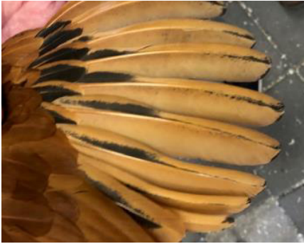
Vleugel tekening moet hier wat intensiever