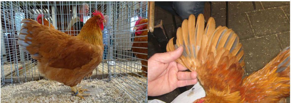
Een blauw getekende hen en de blauwe vleugeltekening

Een bekende Friese keurmeester zei vaak: de blauwe kleur bij tekeningdieren is geen kleur, maar een toestand. En dat klopt. Je kunt namelijk geen fok zuivere (homozygote) blauwgetekende dieren fokken. Het is eigenlijk een tussenkleur. En die is fok onzuiver (heterozygoot). Kruist men een blauwgetekende hen met een blauwgetekende haan, dan ontstaan er wat tekening betreft drie kleurslagen, theoretisch 50 % blauw getekend, 25 % vuilwit getekend en 25 % zwart getekend. Ga je dus fokken met alleen blauwe dieren, dan heb je in theorie 50 % blauwgetekende kuikens en verder zwart getekende en vuilwit getekende kuikens, theoretisch elk 25 %. Mogelijk moet over de diverse varianten nog eens een artikelje geschreven worden op deze site. Onze hobby blijft interessant.